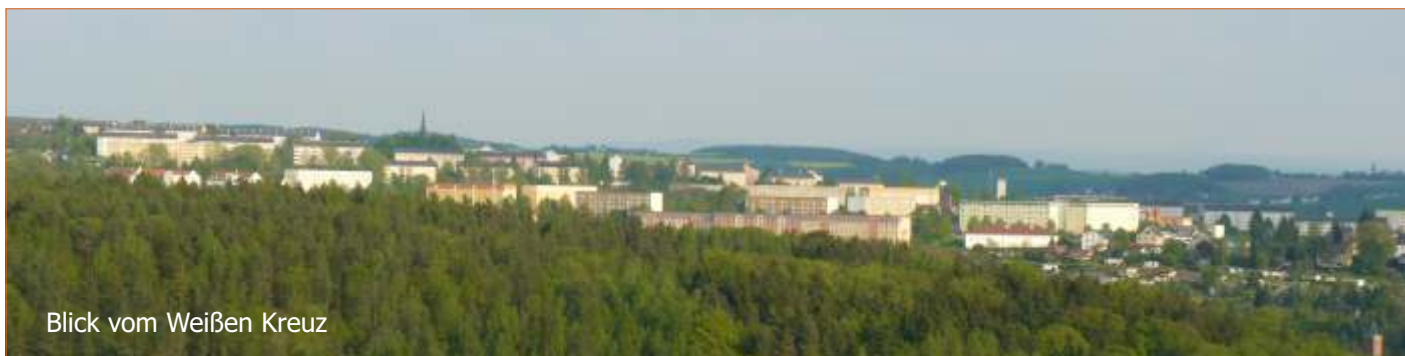
Blick vom Weißen Kreuz